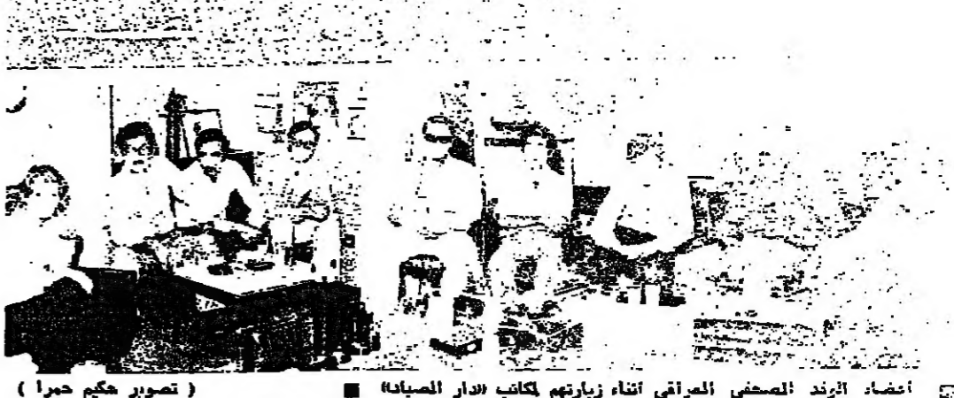
أعضاء الوفد الصحفي العراقي أثناء زيارتهم لكتاب « دار الصباح »

وعلى مقربة من منزل مهتم ٢ تحدثت الى احد المسؤولين في الجبهة الشعبية ، قال : كنا نتظر ان يحصل هكذا اعتداء ، ردا على عملياتنا المتصاعدة داخل الأرض المحتلة . لكن القذرات ان تحل الى قربنا الوطن ، وسخبيت آمال العدو . لنا سئلته لدرس تل الآخر ، وسنظل نواصل خربتنا المرحمة حتى تتحرر ارضنا .